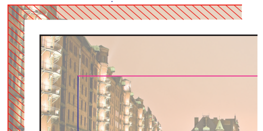
Ihr Motiv im Endformat mit abgeschnittener Beschnittzugabe

3. Bitte achten Sie darauf, im Beschnitt keine Elemente zu platzieren, welche nicht angeschnitten werden sollen. Halten Sie für diese Elemente einen Sicherheitsabstand von 4 mm zum Rand ein. Die Beschnittzugabe dient lediglich der optimalen randlosen Produktion und wird am Ende nicht in Ihrem Druckprodukt zu sehen sein.