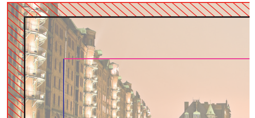
Ihr Motiv inklusive Beschnittzugabe