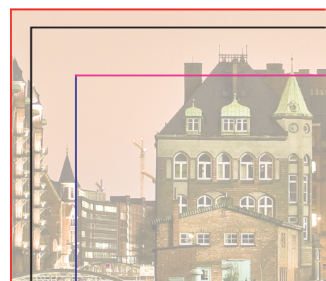
Ihr angelegtes Motiv inklusive Beschnittzugabe